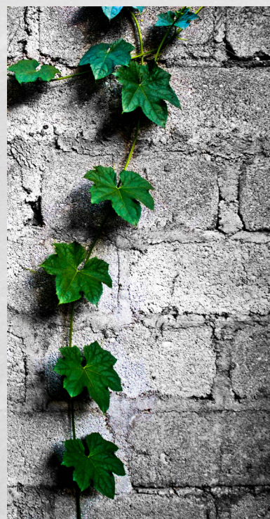
بعضة: حارث الرائدي