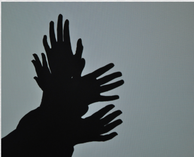
من نتائج مجموعات الورشة