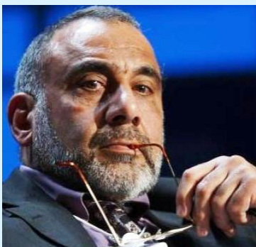
٦٦ عادل عبد المهدي

كلما اقرأ أو استمع لرأي مخالف، حتى المزعجة منها، كلما اشعر بالاطمئنان اننا انتصرنا لمعركة الحرية. فالناس اليوم احرار في بلادي، او يسرون في طريق فك اغلال القمع وتعلم دروس الحرية. فالناس عندنا يستطيعون انتقاد اي مسؤول او اية سياسة دون خوف حقيقي من عقوبة وملاحقة. على العكس، ارى ان المسؤولين يخافون الناس اكثر من خوف الناس من المسؤولين. فالحرية اليوم في بلادي واسعة وكبيرة ولن يقدر كثيرون قيمتها، الا اذا فقدوها لا سمح الله..